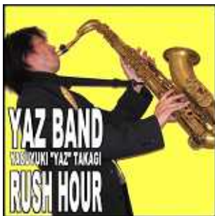
3rd CD " RUSH HOUR " 2007 年 12 月

*これらの CD は YAZ BAND のホームページ www.yazband.com で購入できます