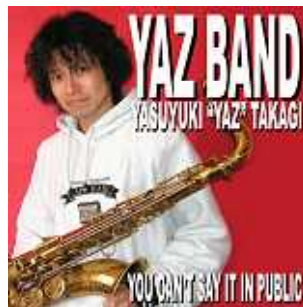
2nd CD "You Can't Say It In Public" 2005 年 2 月